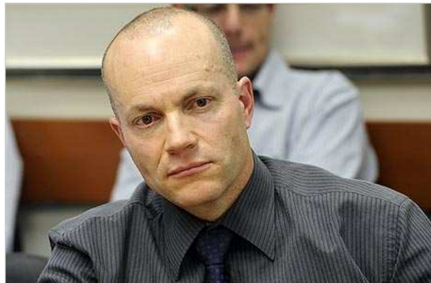
פרופ' עומר מואב, "למחלקות לכלכלה בישראל יש עדיין מוניטין לא רע, אבל קשה מאוד לשמור על הרמה. אנחנו מתקשים לגייס את הצעירים הכי טובים, וגם המחלקות הצטמצמו באופן ניכר".

פרופ' יוסי זעירא מהמחלקה לכלכלה, שאחראי על הדוקטורנטים באוניברסיטה העברית, מנסה לדאוג לכך שתלמידי התואר השני והדוקטורט יקבלו מלגות ראויות שיאפשרו להם להתמקד בלימודים. "זה אחד הנושאים הכי חשובים שאנחנו מנסים לטפל בהם", הוא אומר. "צעירים ישראלים מגיעים לאקדמיה בגיל מאוחר יחסית וזה פוגע בהתקדמות האינטלקטואלית שלהם. צריך לעזור להם".