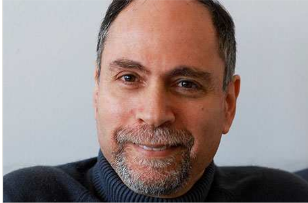
פרופ' אייל וינטר. "בתוך שנה נפנה לסטודנטים מארצות הברית, אירופה וסין, כך שהתוכנית תהיה כמו כל תוכנית מובילה בעולם. למה כולם חוץ מישראל יכולים להרשות את זה לעצמם?"

וינטר מכיר מקרוב את פערי ההשקעה באקדמיה בין ארצות הברית לישראל. "כל התקציב השנתי של המרכז לחקר רציונליות, כ-450 אלף דולר, שווה למשכורת שנתית של איש סגל בכיר אחד במחלקה מובילה לכלכלה באוניברסיטה אמריקאית. התקציב של מרכז המחקר באוניברסיטת וושינגטון גדול מהתקציב שלנו פי שמונה. גם בתנאים האלה אנחנו מצליחים להגיע להישגים יפים, ויש כמה תחומים בכלכלה - למשל תורת המשחקים או כלכלה אמפירית - שבהם אנחנו מובילים את המחקר בעולם. אבל בסופו של דבר זה יפסיק לעבוד. את החבל הזה אפשר למתוח רק עד לנקודה מסוימת".