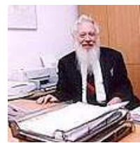
פרופ' רוברט אומן. סוגיות בתלמוד

למודל השלכות בתחום של תחרות בין פירמות כדוגמת דואפול, לעיתים