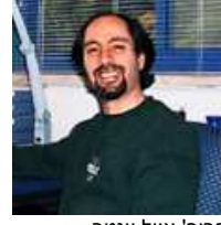
פרופ' אייל וינטר. "מעצמה מחקרית"